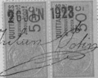
Recibo de la cuota de entrada de ICC España en la Cámara de Comercio, del 26 de enero de 1923